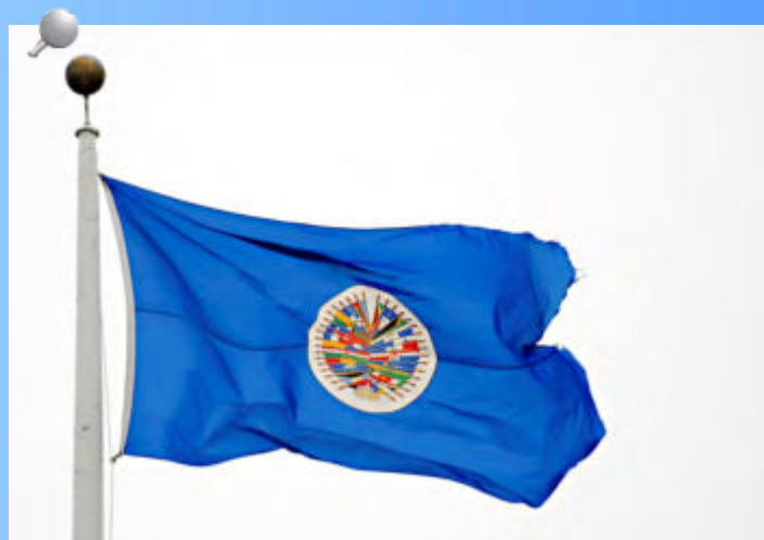
El Tribunal Superior de Cuentas estuvo presente en la Vigésima Octava Reunión del Comité de Expertos del Mesicic que se realizó en la OEA en Washington, DC.

El informe incluyó las medidas adoptadas en la recomendación de evaluar la adecuación del sistema de contratación de funcionarios y empleados públicos del Poder Judicial, Ministerio Público (MP) y Tribunal Superior de Cuentas a la Constitución de la República y la Convención. También las medidas adoptadas para promover las gestiones necesarias con otros Estados y organizaciones de cooperación para proveer al TSC con la cooperación técnica contable, auditoría forense y enriquecimiento ilícito, para que pueda cumplir sus funciones de una manera más eficaz.