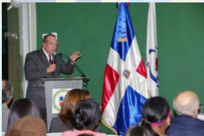
El Presidente de la CCRD durante su conferencia en la Universidad Nacional Pedro Henríquez Ureña.

“Con la modificación a la Ley 10-04 de la Cámara de Cuentas pretendemos tener un mayor poder para nosotros actuar frente a los casos de responsabilidad administrativa y civil de los servidores públicos de las entidades y organismos que están sujetos a esta ley”, dijo.