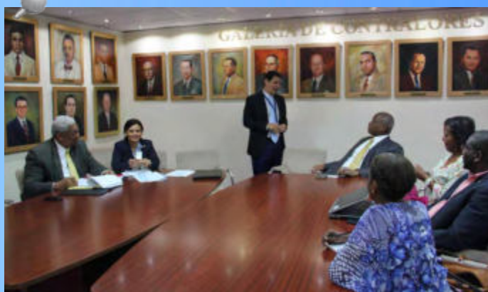
INEC sostuvo una reunión con representantes de agrupaciones afrodescendientes, en la cual se abordaron aspectos relacionados con el Censos Nacionales de Población y Vivienda a realizarse en el año 2020.