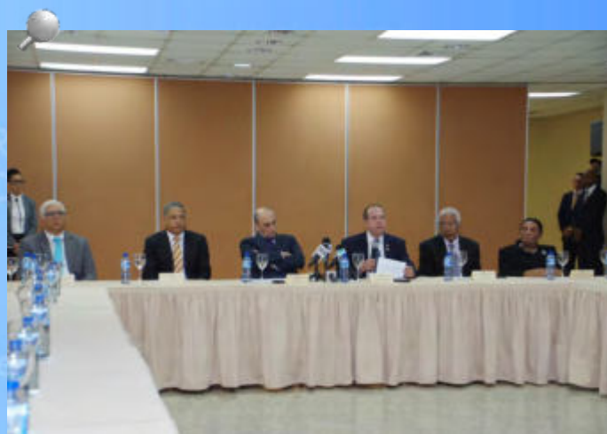
La Cámara de Cuentas de la República Dominicana (CCRD) y el Programa de las Naciones Unidas para el Desarrollo (PNUD) anunciaron la creación del programa “Ojo Ciudadano” durante una conferencia de prensa.

El presidente de la CCRD explicó que entre los beneficios que brindará la nueva plataforma de la institución se encuentran las denuncias vía telefónica y de manera presencial, las cuales serán ingresadas en dicho sistema para su seguimiento y transparencia.