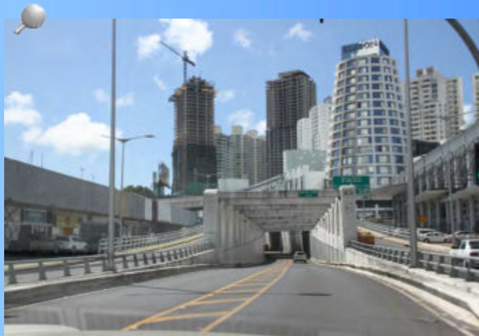
Corredor Vía Brasil Tramos I y II.

La Contraloría General de la República continúa llevando adelante auditorías de otros proyectos de infraestructura solicitados por el Ministerio Público y tal cual los procesos adecuados, continuará a disposición del mismo para ampliaciones de los informes presentados, de así ser requeridas.