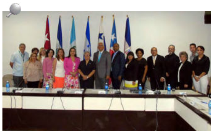
El grupo de trabajo de Comunicación e Imagen de la OCCEFS es integrado por representantes de las EFS de Honduras, Cuba, El Salvador, Guatemala, República Dominicana, Puerto Rico y Panamá.

Se concertó en el encuentro que el portal deberá contar con un manual de procedimientos que defina a quienes corresponden las responsabilidades, además de un manual de estilos para el contenido que se publique en la web y otro para el Boletín. También se dispondrá de dos estrategias de posicionamiento una para el sitio web de la OCCEFS y otra para redes sociales con el objetivo de reforzar la credibilidad e imagen de las instituciones fiscalizadoras.