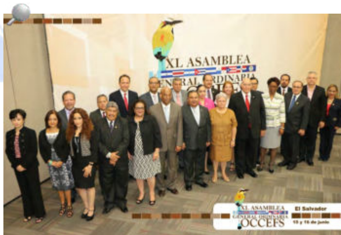
La Asamblea XL General Ordinaria de la OCCEFS, contó con la participación de titulares o representantes legales de 10 entidades fiscalizadoras.

Finalmente, se aprobó que el Estado Libre Asociado de Puerto Rico sea la sede de la XLI Asamblea General Ordinaria de la OCCEFS que será celebrada del 22 al 23 de junio de 2017.