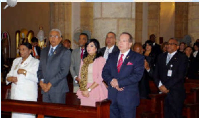
Misa por el 163 aniversario de la Cámara de Cuentas de la República Dominicana.