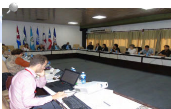
El equipo de Comunicación e Imagen de la OCCEFS tuvo como primera actividad diseñar una política de comunicación para la Organización período 2017-2022.

14. Trabajar en la agenda de trabajo de la Asamblea General de la OCCEFS.