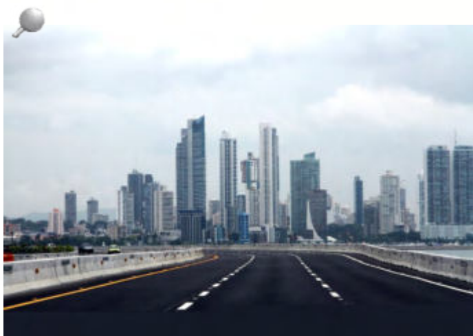
Cinta Costera II y III.