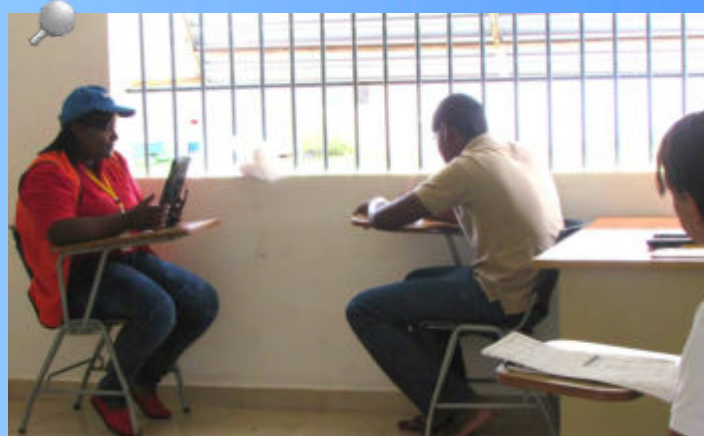
Encuestadores fueron capacitados en el Centro de Cumplimiento de Pacora y Centro Penitenciario de Tinajitas.