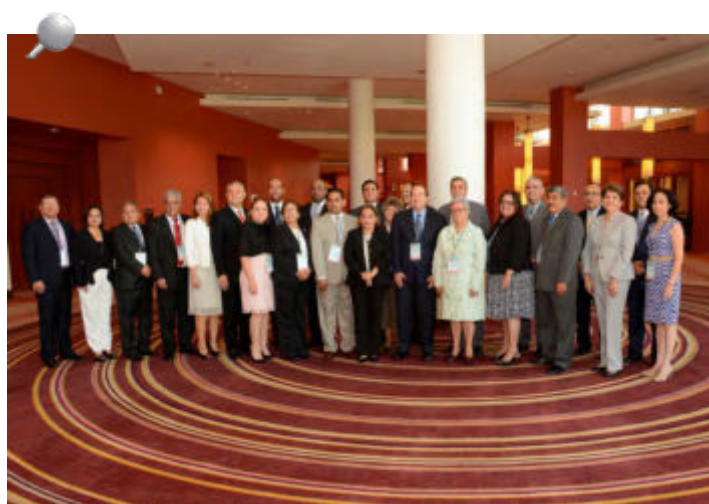
Titulares y delegados que asistieron a la XLI Asamblea de OCCEFS.

Durante la noche tuvimos una espectacular cena de gala, donde las delegaciones disfrutaron de una exquisita cena y un concierto de primavera con música puertorriqueña y de salón, interpretado por el coro de voces del Concertino Coral y por la Big Band de la Orquesta Filarmónica de Bayamón.