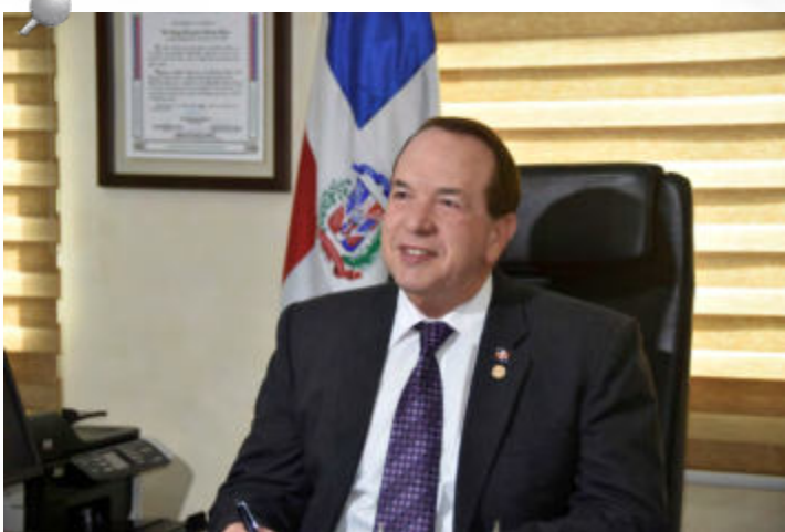
El presidente de la Cámara de Cuentas de la República Dominicana (CCRD), licenciado Hugo Álvarez Pérez.

Explicó que la CCRD para la ejecución de otros planes y la realización de un trabajo con calidad, profesionalismo y oportunidad, conforme a las exigencias de la ciudadanía, requiere de un mayor presupuesto.