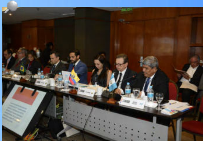
La XXVII Asamblea General Ordinaria de la OLACEFS se llevó a cabo en Paraguay durante el mes de octubre.