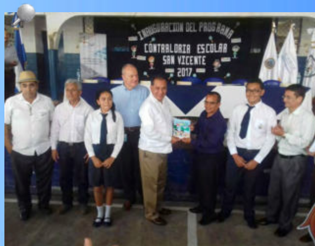
Autoridades de la Corte de Cuentas de la República, Ministerio de Educación y Agencia de Cooperación Alemana (GIZ), durante lanzamiento de la fase II del “Programa de Contraloría Escolar”

El respaldo de la GIZ al Programa de Contraloría Escolar se da en el marco del Proyecto “Buena Práctica Fiscal” que promueve los mecanismos de transparencia y participación ciudadana. Con la ejecución de esta segunda fase del Programa se da por sentado el compromiso del Organismo Superior de Control, del MINED y de la GIZ en el proceso de formación de las futuras generaciones, en materia de transparencia y cuidado de los recursos nacionales.