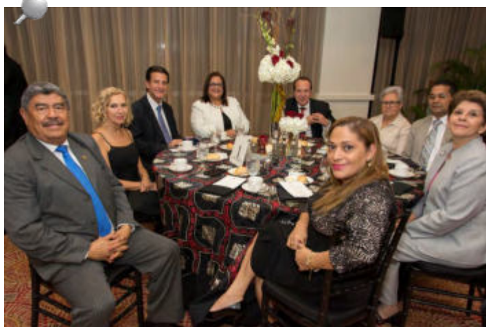
Representantes de las diferentes EFS compartiendo durante la cena de gala en la Asamblea General Ordinaria de la OCCEFS.

En la tarde, una vez finalizados los trabajos de la Asamblea, las delegaciones participaron de un recorrido por la parte histórica de la capital de Puerto Rico, el Viejo San Juan.