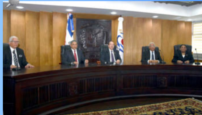
Miembros de la CCRD solicitaron el apoyo del BID para desarrollar dos proyectos para fortalecer la institución.