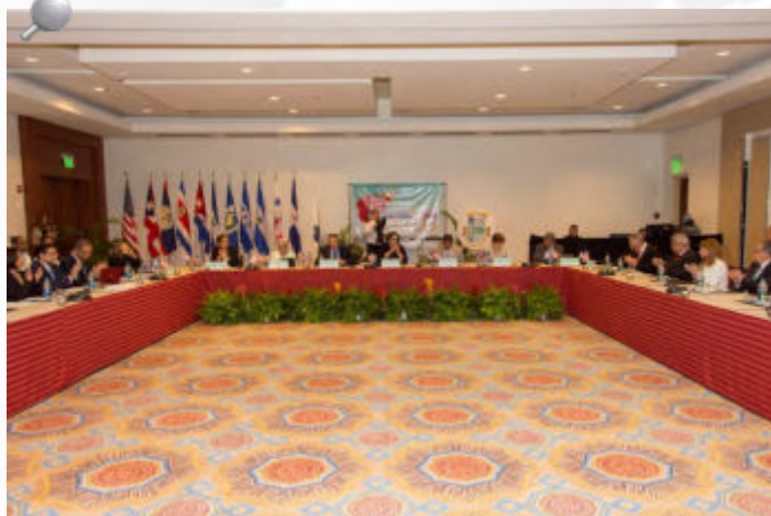
Durante la Asamblea, se aprobó el Informe del Presidente y el Informe del Secretario Ejecutivo de OCCEFS, entre otros.