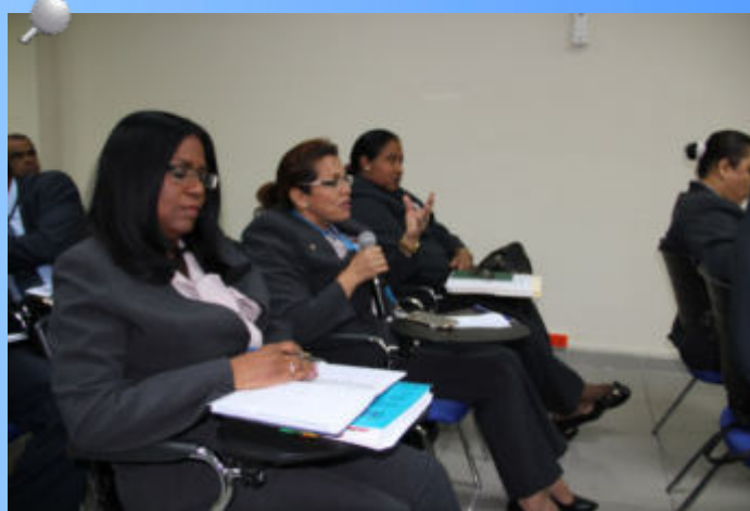
Reuniones de los equipos de trabajo responsables del proyecto de implementación de las ISSAI.