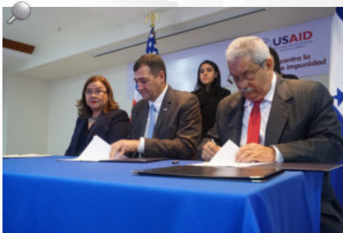
La USAID firmó Memorándum de Entendimiento con el IAIP y TSC.

Dado que la transparencia es un pilar fundamental de la democracia y el desarrollo de los pueblos, la USAID seguirá trabajando con el Gobierno de Honduras para fortalecer las instituciones públicas que velan por la correcta gestión de los recursos del Estado, y a su vez, con la ciudadanía para fomentar que estos exijan la rendición de cuentas en el quehacer público.