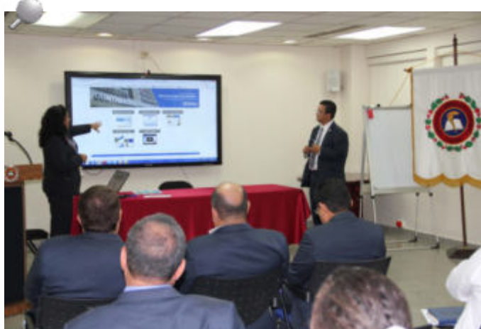
Durante la presentación del sitio donde se habilitará información de los avances en la implementación de las ISSAI.