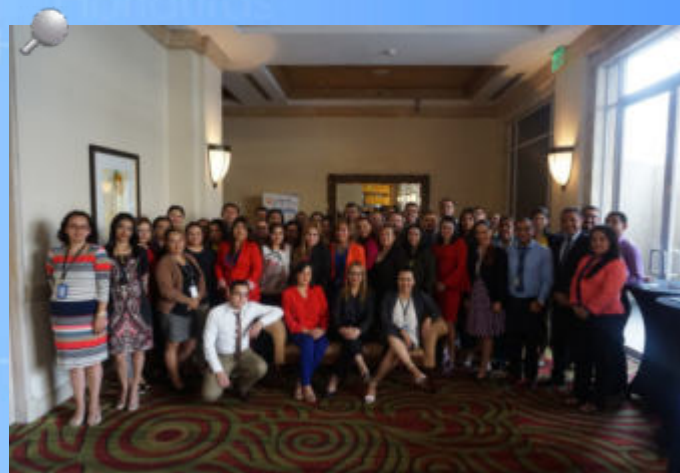
Parte de los auditores que recibieron la capacitación basado en Normas ISSAI.

Los auditores participantes laboran en la Gerencia de Auditoría Sectorial Gobernabilidad, Inclusión Social y Prevención, Seguridad y Cooperación Internacional; Gerencia de Auditoría Sectorial Desarrollo, Regulación Económica, Infraestructura Productiva, Recursos Naturales y Ambientales; Dirección de Municipalidades, de Desarrollo Institucional y de Auditoría Interna.