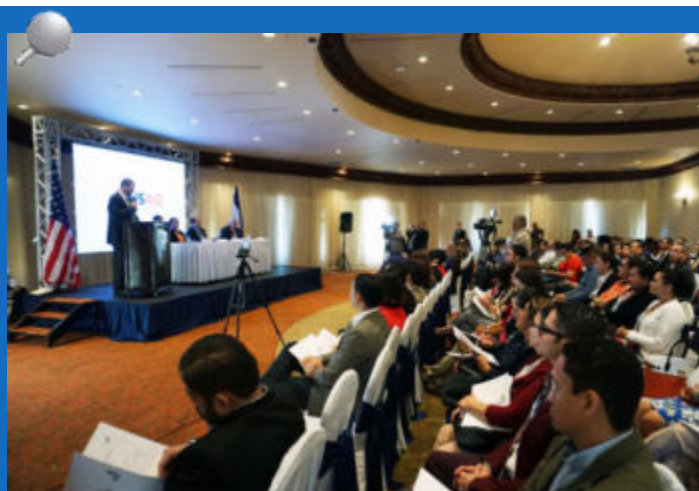
El Programa de Integridad y Ética Pública fue presentado a representantes de los tres poderes del Estado, cuerpo diplomático y sociedad civil.