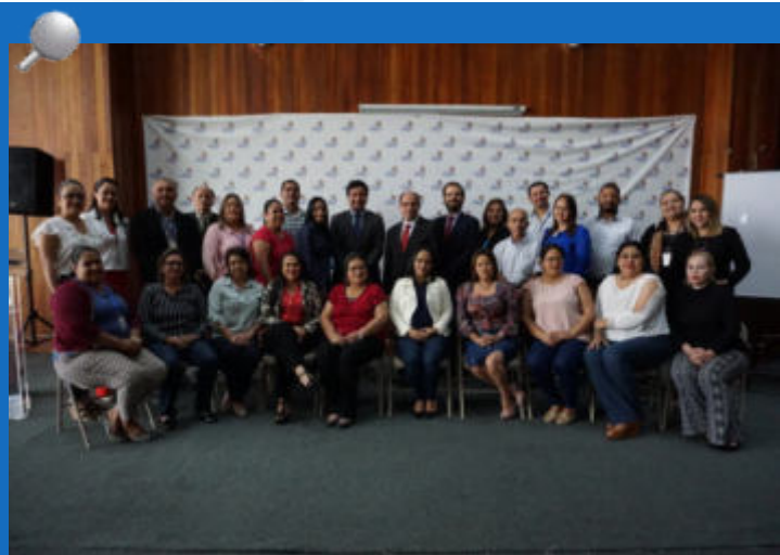
Funcionarios de la Secretaría de Educación participantes en la aplicación de la herramienta SAINT junto a expositores y organizadores del TSC.