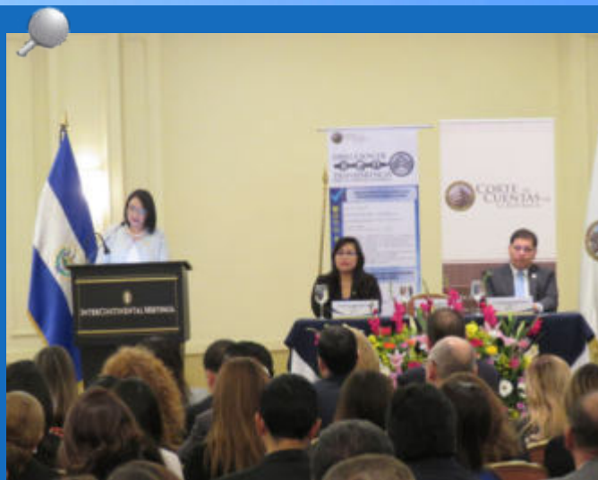
El evento es parte de la política de Transparencia implementada por los actuales funcionarios, la cual representa el deseo de construir una gestión transparente y eficiente.

Los Magistrados mediante diferentes acciones de divulgación, han mantenido acercamientos con la población por los canales de comunicación internos y externos, los cuales día a día se ha dado a conocer las actividades y programas realizados orientados a promover el buen uso de los recursos y bienes públicos.