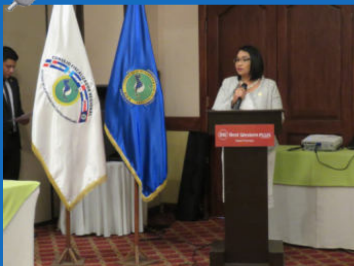
Auditores regionales de las unidades enlace del CFR-SICA de El Salvador participan en Seminario sobre Integración Regional y Derecho Comunitario.