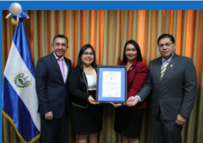
La CCR obtuvo el certificado de renovación del sistema de gestión de la calidad y sus procesos institucionales bajo la norma ISO 9001 versión 2015.

Dicha certificación tendrá una vigencia de tres años que vencerán el 31 de agosto de 2021. Las autoridades de la CCR agradecieron el aporte del talento humano para el logro de esta certificación internacional, y se mostraron muy optimistas de contar con el concurso de todos para alcanzar nuevos resultados institucionales en beneficio del país.