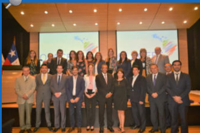
El Taller concluyó con la conformación de la red de Comunicadores de las EFS.

Los participantes compartieron conocimientos y experiencias para mejorar los procesos de comunicación y así poder acercar más a los usuarios los resultados de los productos realizados a los organismos.