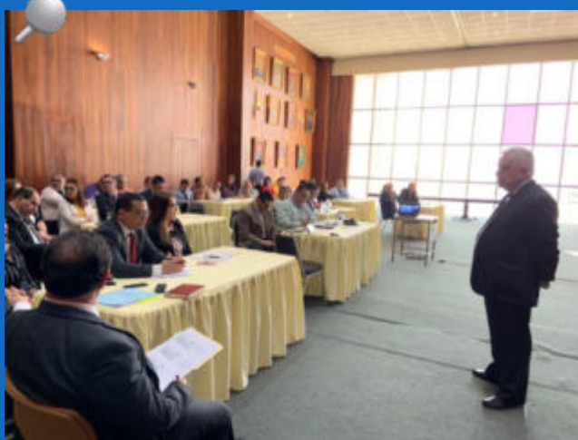
El taller de socialización ofrecido al personal del TSC involucrado en la investigación de Enriquecimiento Ilícito, representantes de la MACCIH, Ministerio Público y de la ASJ.