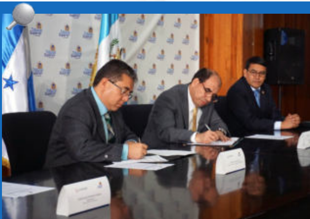
El Convenio fue firmado por el presidente del TSC, Roy Pineda, y el contralor general del Perú y presidente de Olacefs, Nelson Shack. Observa el contralor general de Guatemala, Edwin Salazar.

La reunión trilateral continuó en horas de la tarde, por parte de los titulares de las tres EFS representadas. En especial, los contralores de Guatemala y del Perú abordaron el inicio de la elaboración del Plan Estratégico Institucional de la OCCEFS, como se acordó en la Asamblea General del organismo celebrado en el mes de julio en La Habana, Cuba.