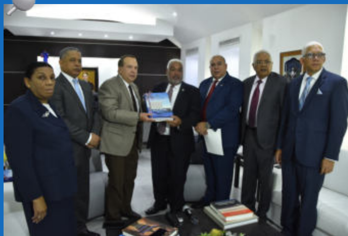
Entrega del Informe en la Cámara de Diputados.

El informe entregado a ambas cámaras legislativas consta del ejercicio presupuestario del Gobierno Central, de los Organismos Descentralizados y Autónomos, de las Municipalidades y las ONG's.