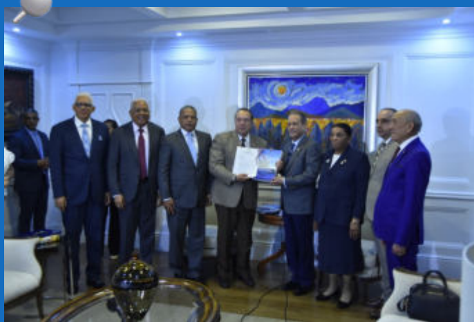
Entrega del Informe en el Senado de la República.