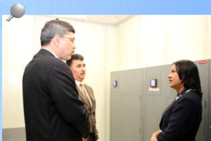
Autoridades recorren las instalaciones del centro de datos.