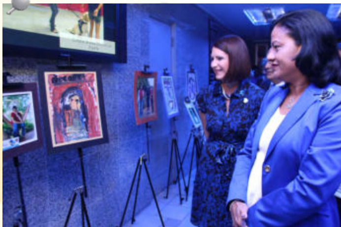
La Primera Dama de la República de Panamá, Marta Linares de Martinelli y la Contralora General, Gioconda Torres de Bianchini, observan las obras realizadas por los jóvenes autistas.

La Asamblea General de las Naciones Unidas declaró el día 2 de abril el Día Mundial de Concienciación sobre el Autismo, a fin de poner en relieve la necesidad de ayudar a mejorar las condiciones de vida de los niños y adultos que sufren este trastorno. En Panamá, mediante Decreto Ejecutivo No.282 del 4 de abril de 2011, se estableció abril como el mes de concienciación del autismo, por lo cual se desarrollan actividades alusivas y se toman medidas relacionadas con esta condición, lo cual apoya plenamente nuestra Institución.