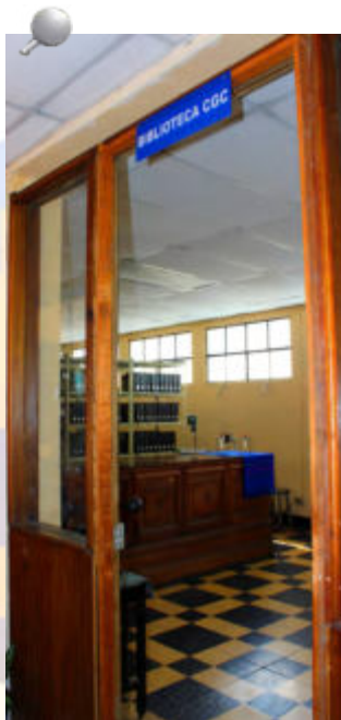
Recepción de la Biblioteca de la Contraloría General de Cuentas.

En la biblioteca se puede consultar una Colección de leyes, cuya sección se divide en leyes nacionales, e internacionales; y una Colección de Hemeroteca, constituida por títulos de revistas especializadas, Diario de Centro América, memorias e informes nacionales e internacionales.