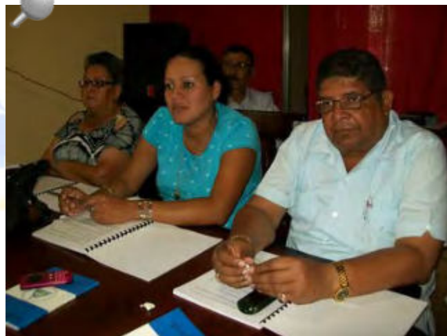
Servidores públicos de Municipios de Jinotega son capacitados por la Contraloría General de la República.