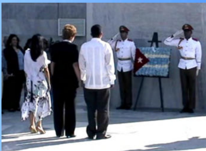
Los auditores cubanos firmaron el Código de Ética que regirá a partir de el presente año. El acto tuvo lugar el 28 de enero en saludo al aniversario 160 del natalicio del Apóstol de Cuba, José Martí.