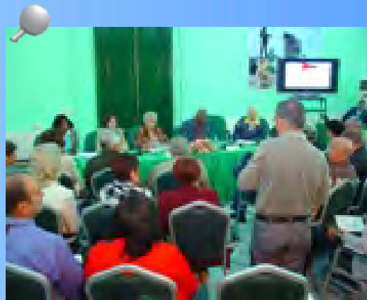
La reunión del Consejo Ampliado de la Contraloría General de la República tuvo el objetivo de celebrar en sesión especial el balance de trabajo 2012 del Sistema Nacional de Auditoría cubano (SNA).

Se hizo mención a los avances que va mostrando la actividad de capacitación en cuanto a calidad de los cursos, la publicación del Portal de capacitación nacional como parte del programa nacional de capacitación, y la colaboración recibida desde de Latinoamérica, el Caribe y otras diversas regiones.