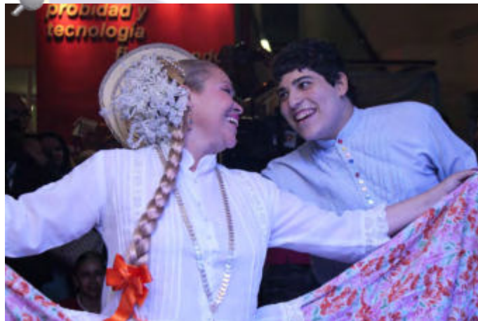
Jóvenes e infantes autistas que forman parte del Conjunto Típico de la Fundación Soy Capaz.