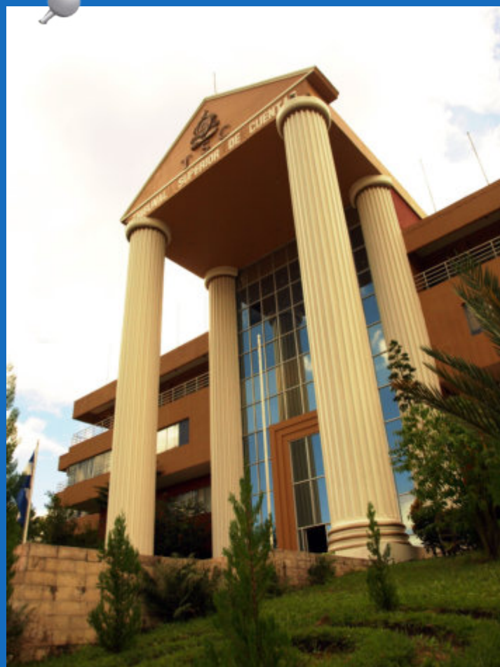
El 20 de enero el Tribunal Superior de Cuentas arribó a 18 años de vida institucional, como Ente rector del sistema de control de los recursos.

Asimismo, el TSC contribuye a una gestión eficiente, eficaz e integra de los recursos público, mediante el empleo de valores corporativos de objetividad, transparencia, integridad; y personales de compromiso, proactividad y honestidad.