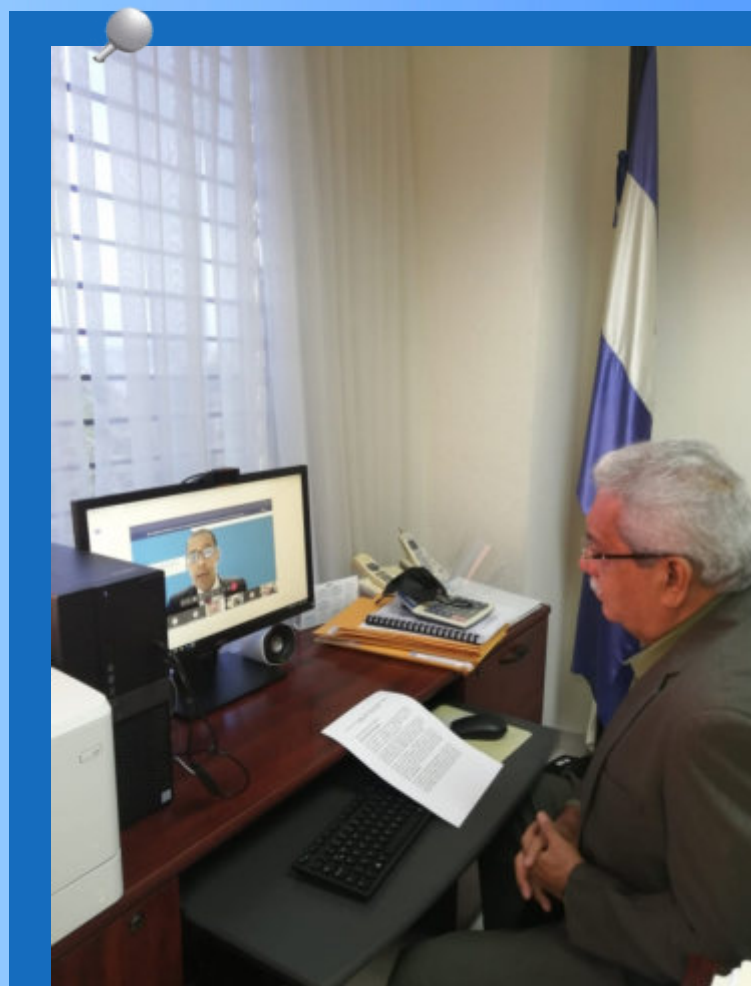
El magistrado presidente del TSC, Ricardo Rodríguez, durante la jornada de capacitación virtual ofrecida por ONUDC, sobre temas relativos a la prevención y lucha contra la corrupción.

“Animamos aprovechar estos espacios y reiterar nuestro compromiso en seguir profundizando los principios de la Convención, aprovecho para agradecer a la UNODC por su apoyo al Ente Contralor, esperando nuevas oportunidades para seguir aprendiendo”, concluyó el magistrado presidente.