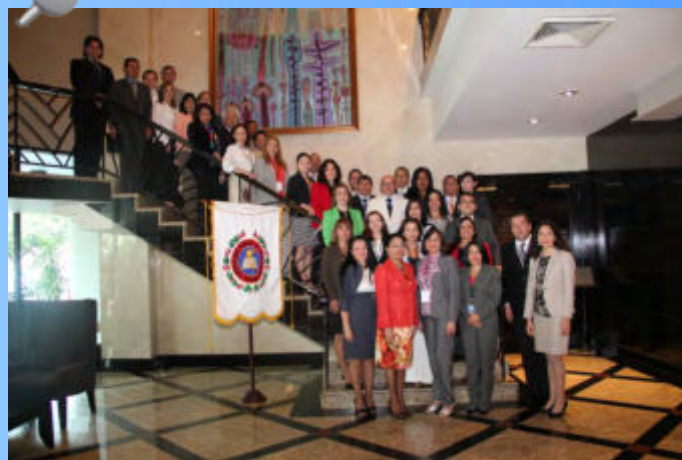
Contralora de Panamá, Gioconda Torres de Bianchini, inaugura Taller de la IDI/OLACEFS.

Las partes interesadas está conformada por el público en general, el legislativo, los entes auditados, las ONGs y todo aquel que puede sacarle provecho o tener interés en los informes de auditoría, el principal producto de las Entidades Fiscalizadoras Superiores (EFS).