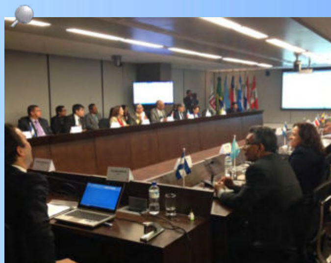
El TSC se hizo presente en el taller “3i para la alta gerencia de las Entidades Fiscalizadoras Superiores (EFS)” que tuvo como objetivo la concienciación sobre los aspectos relacionados con la implementación de las normas ISSAI.

El taller se realizó en las instalaciones del Tribunal de Cuentas de la Unión (TCU) de Brasil y los gastos de viaje y estadía fueron costeados por el Banco Mundial (BM), según lo informado.