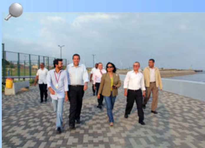
La Contralora General de la República de Panamá, Gioconda Torres de Bianchini, su equipo directivo y el contratista realizaron un recorrido por la Cinta Costera III.

Estas visitas de inspección se dan en cumplimiento del compromiso que tiene la entidad fiscalizadora de dar seguimiento a todas las obras que se desarrollan en el país, para garantizar el uso correcto de los bienes y recursos que el Estado.