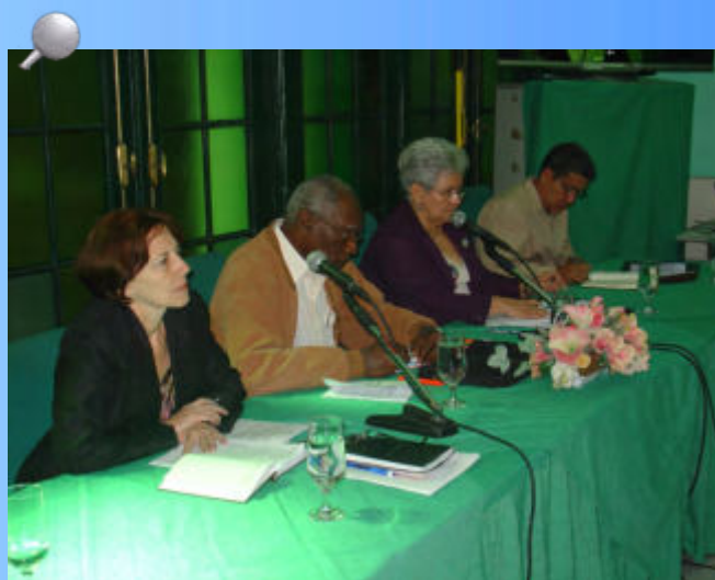
La Contralora General Gladys María Bejerano Portela y los Vicecontralores Acela Martínez y Reynol Perez, presidieron el encuentro donde se realizó el Balance del Sistema Nacional de Auditoría del año 2013.

Otro de los objetivos para el 2014 es intensificar las acciones de prevención y enfrentamiento contra las indisciplinas, ilegalidades y hechos corrupción que contribuyan a frenar y liquidar tales manifestaciones y promover una gestión económica- administrativa más eficiente y proba; y además fortalecer y consolidar las estructuras y funcionamiento de la Contraloría General de la República.