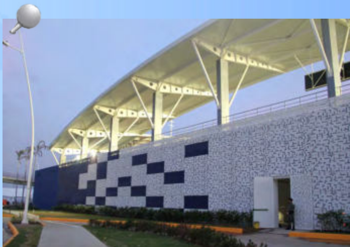
Exteriores del nuevo Estadio Maracaná, con capacidad para 5,500 personas.