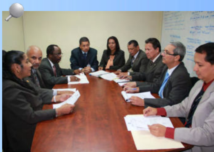
Reunión de trabajo para la elaboración Manual General de Contabilidad Gubernamental

Los capítulos que actualmente han visto la luz, se refieren al marco conceptual, el sector público y sus características, aspectos básicos de la contabilidad gubernamental y el plan general de cuentas. Mientras que, los capítulos pendientes incluirán temas vinculados al proceso contable, el control interno, consolidación de la información financiera y el vocabulario especializado correspondiente.