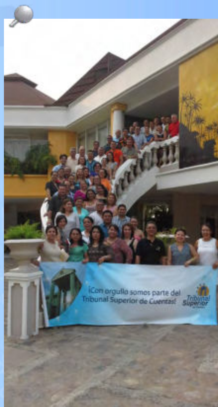
Los empleados y funcionarios del Tribunal Superior de Cuentas participantes en la reunión llevada a cabo en Roma, Atlántida donde se aprobó el Plan Estratégico 2014-2018.