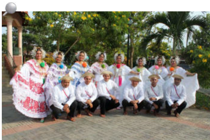
45 Años del Conjunto Folklórico de la Contraloría General.

Además, por el importante rol que desempeña este grupo, como difusor de la cultura y el folklore, la Contraloría General ha dispuesto un salón especial para sus actividades, a fin de que su desempeño siga siendo motivo de orgullo institucional.