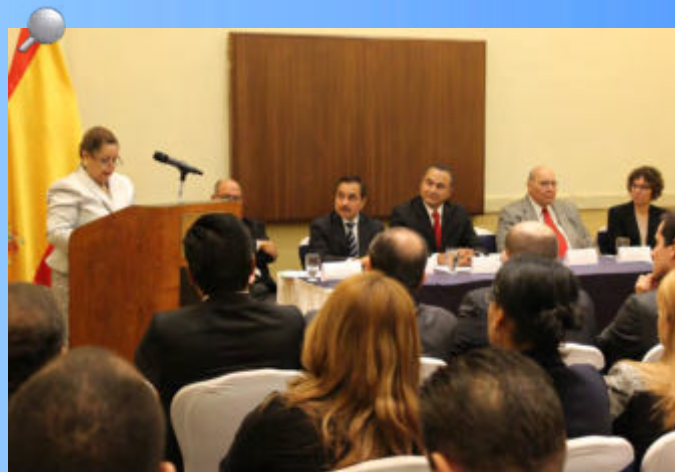
La Magistrada del TSC, Daysi de Anchecta clausuró la fase de capacitación del proyecto resultado del Convenio de Cooperación Triangular entre México, España y Honduras.

En el transcurso de este año se han cubierto varias etapas que han permitido la implementación de un sistema de gestión de calidad para estandarizar los procesos en procura de lograr la certificación ISO-90001-2008 y, además, técnicas de evaluación del desempeño en cuanto a mejores prácticas relacionadas a la gestión de resultados con el objetivo de agregar valor público para nuestro país, tomando la valiosa experiencia lograda por la Auditoría Superior del Estado de Puebla, México, cuyo titular doctor David Villanueva Lomelí viaja a Tegucigalpa, la capital de Honduras, para participar de la clausura mencionada, acompañado de otros altos funcionarios las entidades mexicanas participantes en el proyecto.