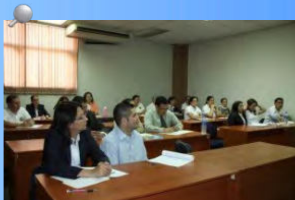
Servidores de la administración pública se capacitaron en el seminario “Redacción de Hallazgos”.

El Salvador El Salvador El Salvador El Salvador El Salvador El Salvador El Salvador El Salvador El Salvador El Salvador