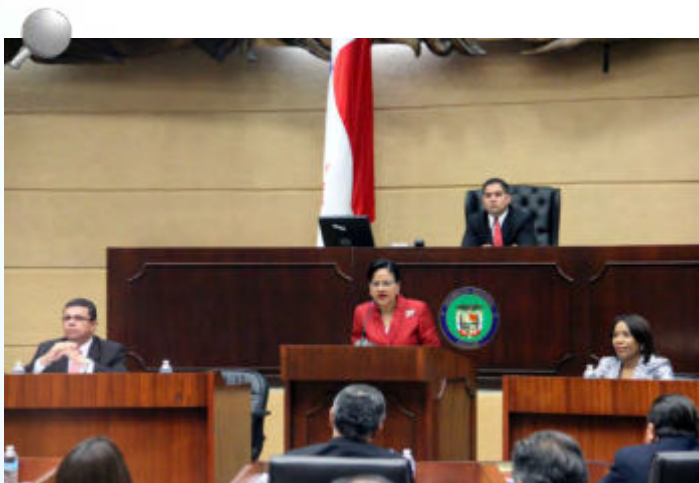
La Contralora General de la República de Panamá, Gioconda Torres de Bianchini, en la Asamblea Nacional de Diputados.

En atención a reciente invitación de la Asamblea Nacional de Diputados, la Contralora General de la República de Panamá, Gioconda de Bianchini y su equipo de trabajo, se presentaron ante el pleno de este Órgano del Estado, para explicar los procedimientos relacionados con el refrendo de contratos, las auditorías, la excepción del control previo y la aplicación del control posterior; así como las transferencias de las partidas a las Juntas Comunales.