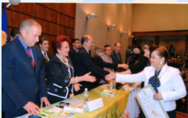
La magistrada Daysi de Anchecta, recibió el reconocimiento de parte del IAIP por el cumplimiento de los requerimientos establecidos por esta institución en su ley.