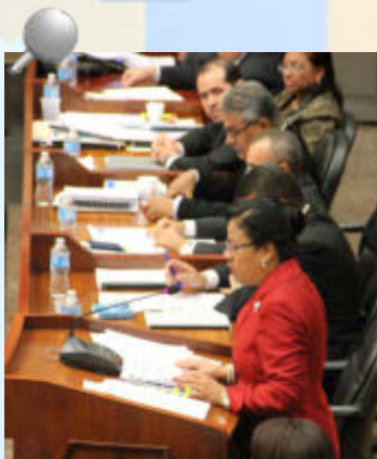
El Equipo Directivo acompañó a la Contralora General de la República de Panamá, respondiendo las interrogantes de los señores Diputados.

Durante su intervención, la Contralora resaltó que: “Toda la revisión de documentos, solicitudes y final aprobación están siempre enmarcadas dentro de lo que mandata la Constitución y las Leyes”. Agregó, que ante cualquier inquietud dirige sus consultas a la Sala Tercera de lo Contencioso Administrativo de la Corte Suprema de Justicia.