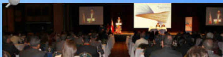
Durante la celebración del VI Congreso de Gestión y Fiscalización de la Hacienda Pública.