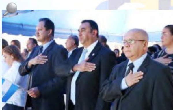
Funcionarios de la Corte de Cuentas entonaron las sagradas notas del Himno Nacional de la República de El Salvador.

El Salvador El Salvador El Salvador El Salvador El Salvador El Salvador El Salvador El Salvador El Salvador El Salvador El Salvador