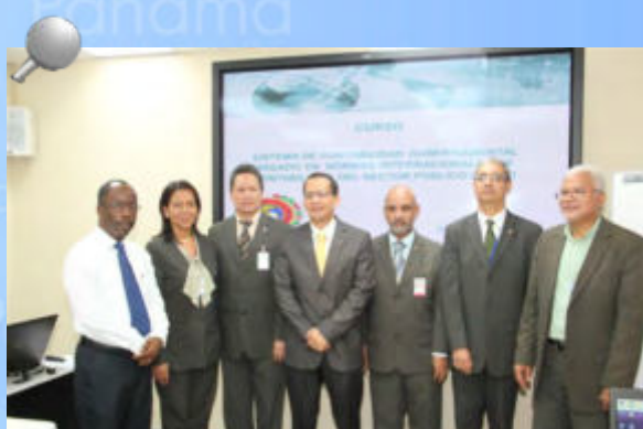
Equipo de Técnico, Especialistas y Facilitadores que participaron en el citado Curso.

Este es el primer evento de capacitación de muchos que deberán realizarse a fin de implementar a nivel nacional los nuevos lineamientos que regirán la Contabilidad Pública.