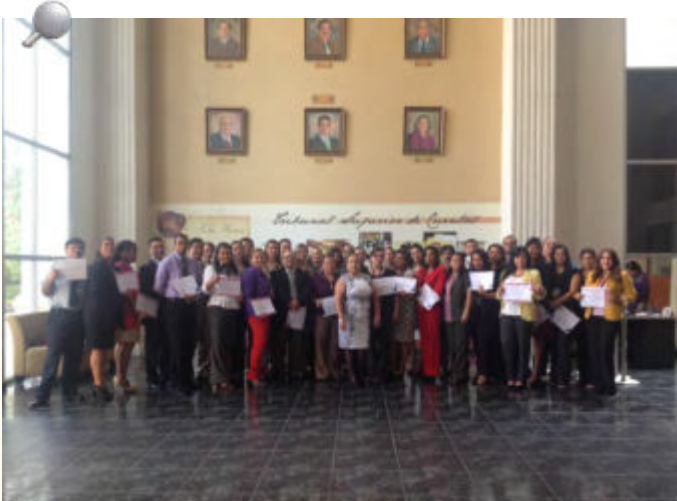
Más de 30 empleados y funcionarios del TSC recibieron sus diplomas de los cursos virtuales y presenciales dictados del periodo comprendido del año 2013 al presente 2014.

Recibieron diplomas varios empleados del TSC sobre Inducción sobre marco normativo de la INTOSAI (GTANIA) y el primer curso regional para la Formación de Moderadores de la Herramienta de Autoevaluación de la Integridad (IntoSAINT).