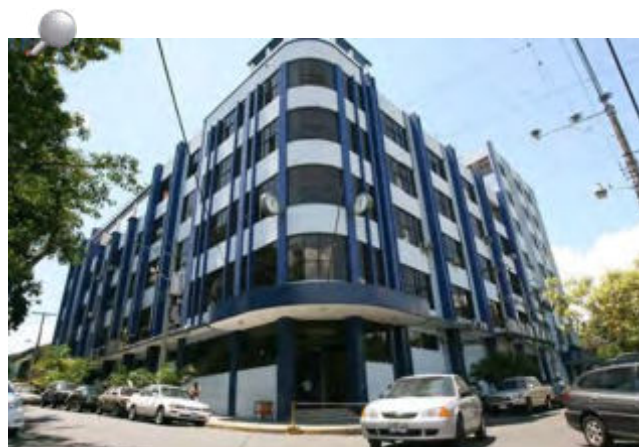
El edificio de la Corte de Cuentas de El Salvador.

En la víspera de esta celebración, se están preparando una serie de actividades que destaquen el importante rol y los aportes de la Corte de Cuentas en beneficio de la población salvadoreña. A las puertas de su aniversario de diamante, las autoridades de la institución invitan a todos los servidores públicos, a continuar trabajando con la ética profesional, calidad y entrega que los caracteriza, comprometidos con el desarrollo nacional.