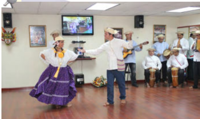
El Conjunto Folklórico de la Contraloría General de la República de Panamá, fue creado el 29 de agosto de 1969. Este grupo cuenta con un salón especial para realizar actividades.