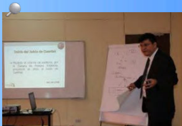
El Centro de Capacitación y de Investigación (CINCAP) impartió una serie de capacitaciones entre las que destacaron: “el trabajo en equipo” y la “Ley de la Corte de Cuentas” y “Auditoría de Sistemas Informáticos”

Entre otros eventos desarrollados también destaca el Seminario sobre “Redacción de Hallazgos de Auditoría” para el que se convocaron a 30 servidores de la Administración Pública salvadoreña.