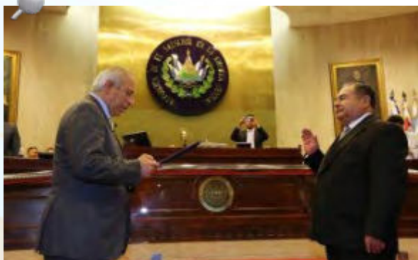
El Presidente de la Asamblea Legislativa, Othón Sigfrido Reyes, juramentó al Lic. Johel Humberto Valiente como Presidente de la Corte de Cuentas de la República.

Antes del acto de juramentación los diputados del parlamento salvadoreño reafirmaron que esta elección cumple con los parámetros establecidos en el Art. 198 de la Constitución de la República y manifestaron su respaldo a los nuevos funcionarios, quienes a partir de esta fecha dirigirán en la Corte de Cuentas y darán continuidad a los planes y programas institucionales para fortalecer la función fiscalizadora y de control de la gestión pública que le compete como Organismo Superior de Control del Estado.