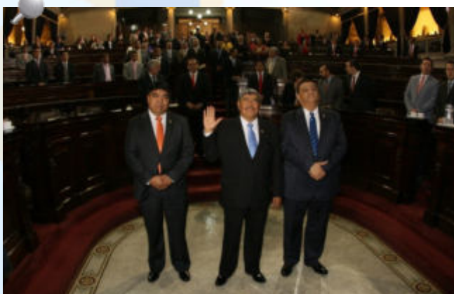
Lic. Carlos Enrique Mencos Morales en su juramentación como Contralor General de Cuentas en el Honorable Congreso de la República de Guatemala

El Contralor General de Cuentas empezó su nueva gestión con mucho optimismo y muchas ganas de trabajar fuertemente en pro de la transparencia y contra la corrupción, enfatizando que hará lo necesario para que la población perciba que verdaderamente se está velando por el buen uso de los recursos públicos y por los intereses de la mayoría y no de particulares.