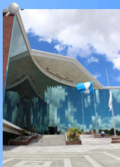
Sede Central de la Contraloría General de Cuentas de Guatemala.

A las puertas de la celebración de un año más de existencia de la CGC, el Contralor General de Cuentas y su equipo de trabajo dan gracias por tener esta oportunidad de trabajar en la Entidad Fiscalizadora Superior cuyo personal se ha caracterizado por su mística, compromiso y vocación de servicio, contribuyendo al desarrollo de nuestro país.