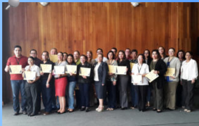
La Presidenta del TSC junto a varios directores entregaron diplomas de varios cursos virtuales impartidos a 51 empleados de la Entidad brindados por la OLACEFS y la INTOSAI.

Las capacitaciones se centraron en calidad y supervisión, en el proceso de auditorías practicadas a las asociaciones públicas y privadas, en los procesos de adquisiciones, seguridad en información de auditorías, a equipos de auditorías coordinadas de recursos hídricos, auditorías basadas en riesgos, así como de ambiente y recursos naturales.