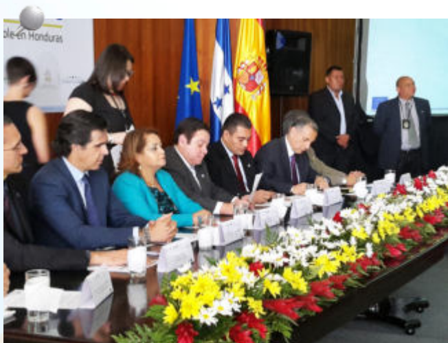
La firma del Documento fomentará la lucha contra la impunidad y el apoyo a la transparencia.

El Programa Eurojusticia plasma el compromiso de la Unión Europea y de España, a través de la Agencia Española de Cooperación Internacional para el Desarrollo (AECID), con la democracia, el Estado de Derecho y los derechos humanos como valores fundamentales y objetivos que deben promoverse mediante las relaciones con el resto del mundo.