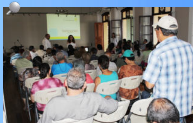
CGR de Costa Rica organiza el encuentro Ciudadano.