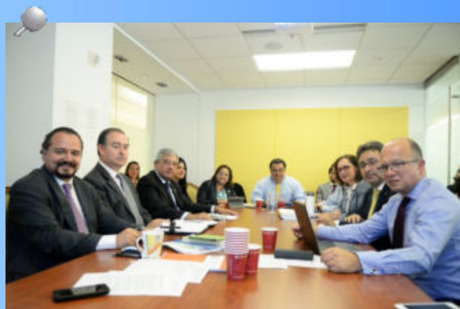
La magistrada presidenta del TSC expuso sobre la labor del Ente Contralor ante un equipo de expertos de la OEA.

Posteriormente, la OEA dispuso un espacio de tiempo para el análisis y otro para preguntas y respuestas.