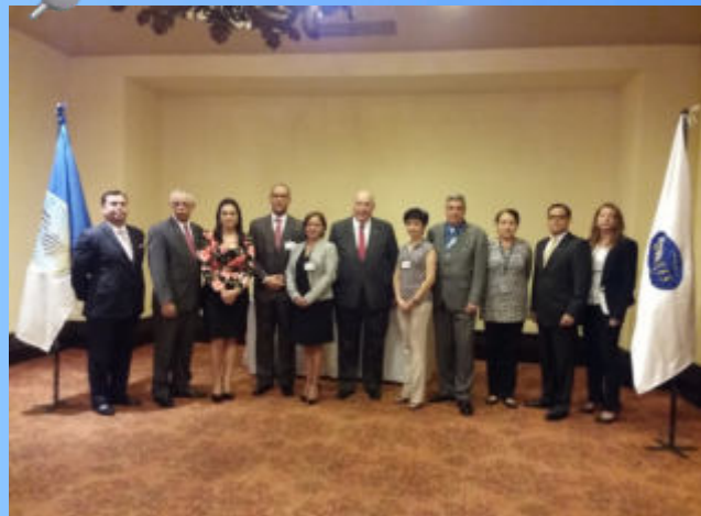
Honduras fue sede de la Reunión de Enlaces Técnicos de la OCCEFS, donde una Unidad Técnica junto a un consultor trabajan en la estructuración del plan estratégico de dicha organización.