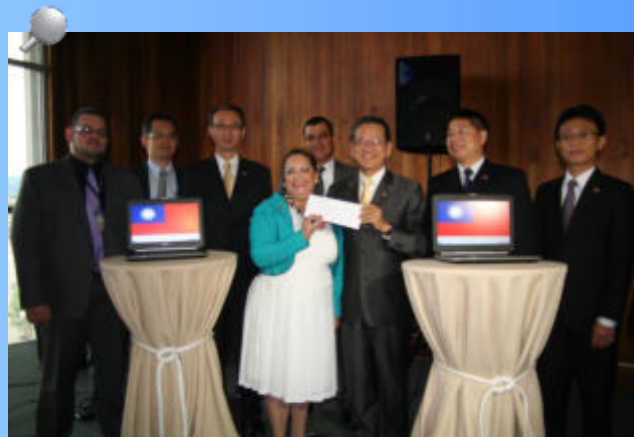
Con la donación de China-Taiwán se tecnificarán las investigaciones de auditoría que realizará el TSC, que permitirá un control integral de los recursos públicos a nivel nacional.

El uso del software tendrá una repercusión importante en el trabajo del auditor, en el uso de tecnología de vanguardia en las auditorías. Permitirá automatizar los trabajos, almacenando la información de forma automática; se podrá realizar el seguimiento de una información de forma más rápida y confiable.