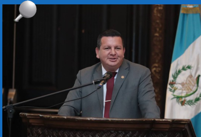
El Contralor General de Cuentas, Dr. Frank Helmuth Bode Fuentes en una actividad oficial de la Contraloría General de Cuentas.

Se estima que en la medida que aumente el espacio de acercamiento y trabajo conjunto con las entidades públicas para comprender el valor de la Confianza como factor determinante que genere espacios de participación, se ampliará la credibilidad ciudadana en las funciones de fiscalización y control gubernamental.