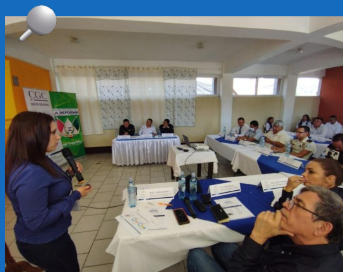
Colaboradores de la Contraloría General de Cuentas se reúnen con personal de diferentes dependencias del Estado para establecer prioridades que generen confianza ciudadana.