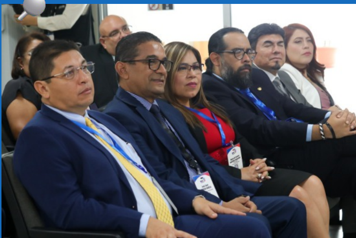
El Tribunal Superior de Cuentas (TSC) fue premiado por desarrollar la mejor práctica de fiscalización en Centroamérica y el Caribe, con el Sistema de Seguimiento de Recomendaciones de Auditoría (SISERA), en un Taller celebrado en El Salvador y organizado por la OCCEFS.

Sobre el tema, el Pleno de Magistrados aprobó la actualización de Normas para la Gestión del SISERA con el propósito de regular el proceso de seguimiento, verificación e implementación de las recomendaciones contenidas en los Informes de Auditoría emitidos por el TSC y las Unidades de Auditoría Interna de las instituciones públicas.