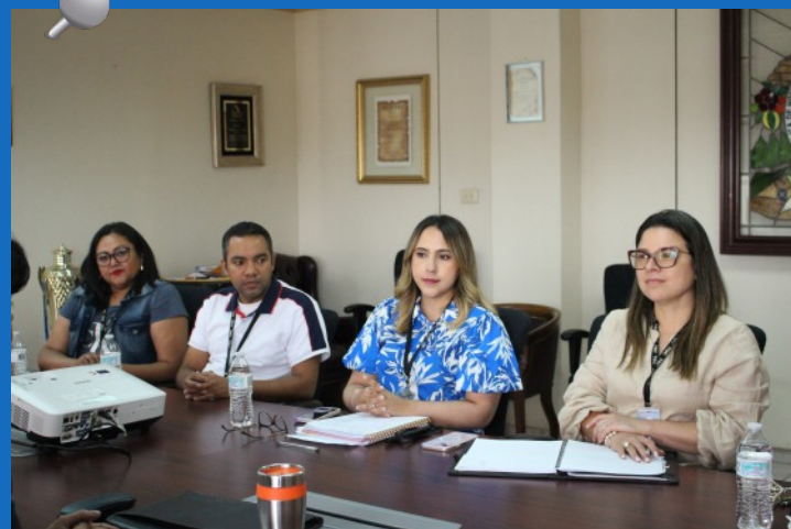
En la reunión participaron representantes de la Unidad de Gestión de Proyectos, Departamento de Formación de Personal, Gerencia de Tecnología y Dirección de Comunicación Institucional.