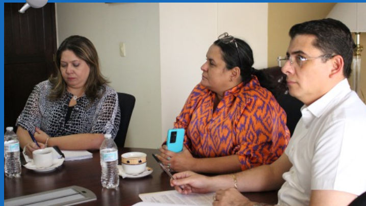
El Pleno de Magistrados destacó la importancia de contar con una nueva plataforma, emprendiendo un paso importante en la enseñanza virtual, fortaleciendo las capacidades operativas y administrativas.