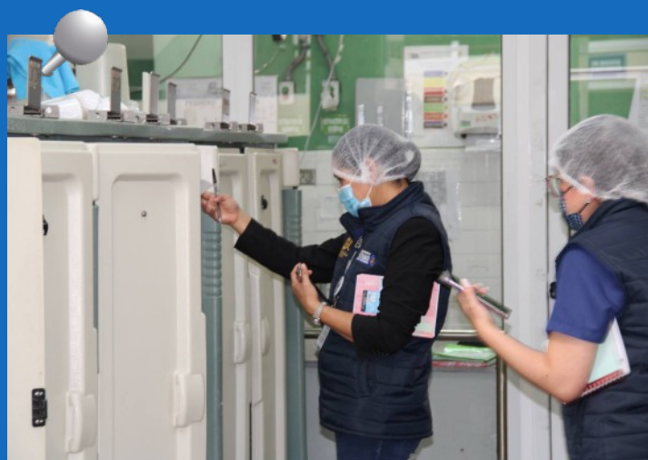
Los auditores del Programa Departamento de Calidad verifican el buen estado de los alimentos en el Hospital Roosevelt.

Las acciones se dan en el marco de la estrategia de prevención contra la corrupción, impulsada por el Dr. Bode Fuentes, y que tiene como prioridad la mejora en la prestación de servicios que las Instituciones del Estado brindan a la ciudadanía en los 22 departamentos del país.