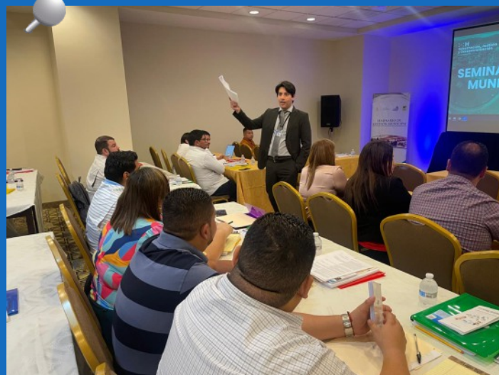
TSC inicia amplio programa de capacitación dirigido a personal de las 298 Municipalidades del país con el propósito de afianzar la cultura de transparencia y rendición de cuentas.

El TSC enfoca sus acciones en prevenir y combatir la corrupción; promoviendo el buen manejo de las cuentas públicas, mediante un efectivo mecanismo de control, apegado a la objetividad, responsabilidad, imparcialidad y capacidad.