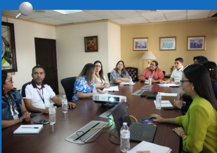
El Pleno del TSC en una reunión de trabajo con diversas áreas de la Institución, en el marco del inicio de la plataforma Moodle, una innovadora propuesta de campus virtual orientado a brindar capacitaciones en línea sobre el MARCI y otras materias.

Asimismo, se elaboró el diseño de 5 de los 6 módulos de curso de MARCI, que consisten en Marco Conceptual del Control Interno, Información General del MARCI, Componentes “Entorno de Control, sus Principios y Normas”, “Evaluación de Riesgos, sus Principios y Normas” y “Actividades de Control sus Principios y Normas”.