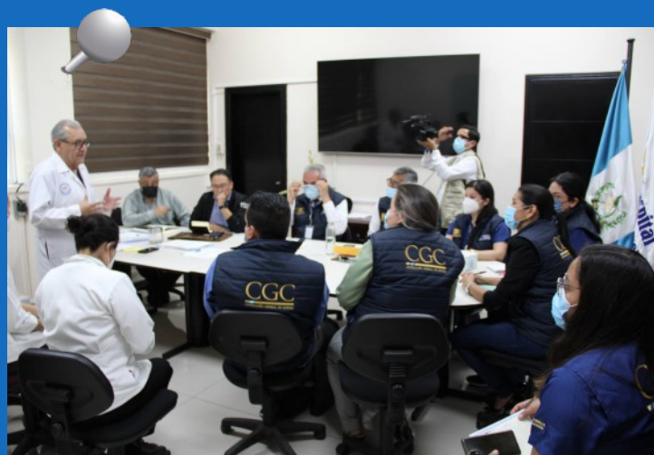
Auditores del Programa Departamento de Calidad se reúnen con autoridades del Hospital Roosevelt. (Foto: CGC).