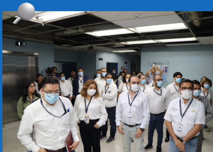
Personal del Programa Municipio Fiscalizado se ubican en el Hospital General San Juan de Dios para monitoreo las diferentes áreas del centro asistencial

Es preciso resaltar que el programa no contempla la realización de auditorías que deriven en algún tipo de acción legal, sino que se enfoca específicamente en el monitoreo que permita obtener información oportuna sobre los servicios públicos que prestan las instituciones del Estado en los municipios del país.