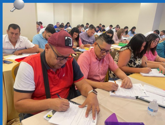
El “Seminario de Fortalecimiento de la Gestión Municipal 2024” se ofrecerá de julio a noviembre, período en el cual se desarrollarán 17 jornadas a nivel nacional, dirigido a Jefes de Contabilidad y Presupuesto, Tesoreros y Jefes de Catastro de las alcaldías del país.