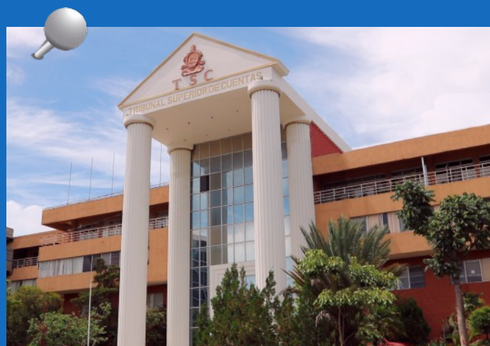
El Tribunal Superior de Cuentas (TSC) arribó a 21 años de ser el ente rector del sistema de control de los recursos públicos del Estado de Honduras

El TSC afianza en cada año su rol fiscalizador con base a la normativa nacional e internacional, con la guía definida en el Plan Estratégico Institucional 2019-2024, desarrollado eficaz y eficientemente por el personal administrativo y operativo que la compone.