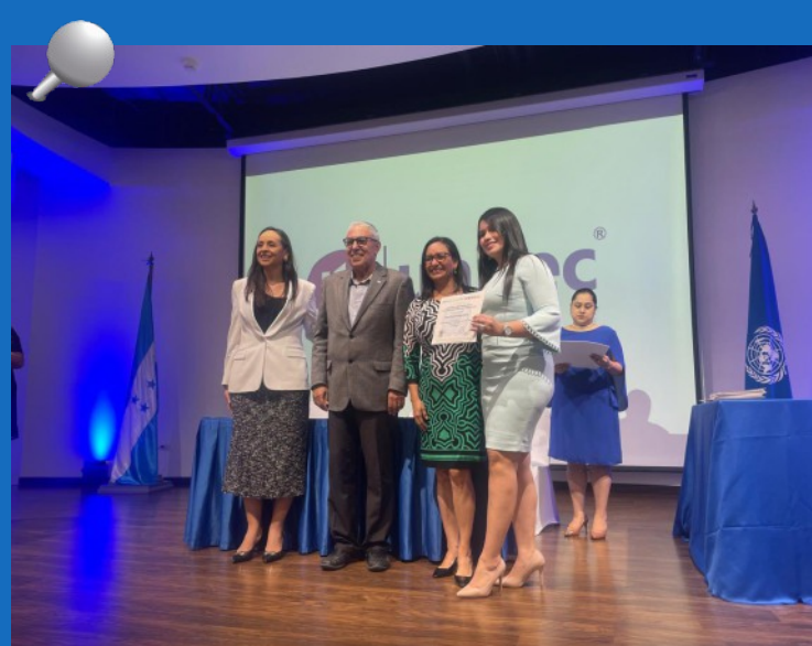
La ceremonia de clausura y entrega de diplomas se celebró el día viernes 23 de agosto en el Auditorio Leticia Ma Tay, de UNITEC.