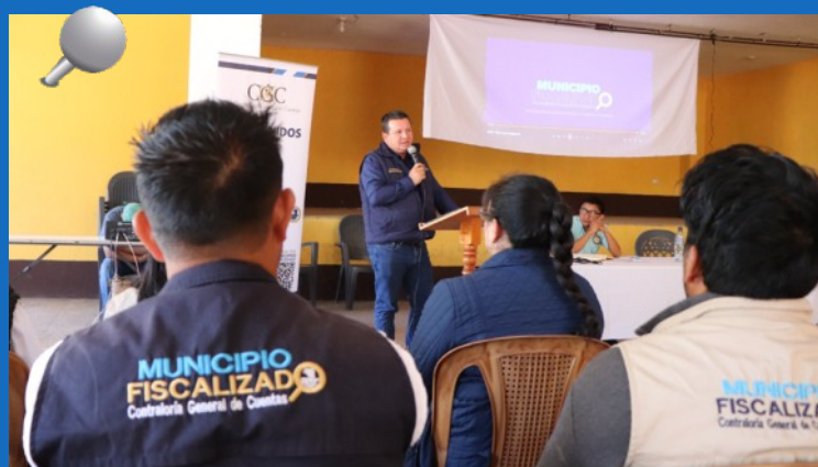
El Contralor General de Cuentas, Dr. Frank Helmuth Bode Fuentes expone los objetivos del Programa Municipio Fiscalizado.

Acá puedes conocer más sobre el Municipio Fiscalizado