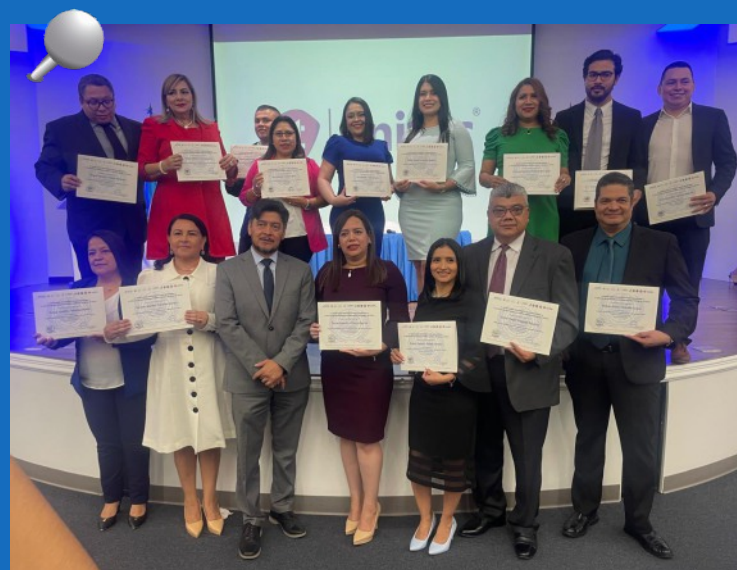
Un total de 15 auditores del TSC culminaron el Diplomado Especializado contra la Corrupción, Lavado y Recuperación de Activos, financiado a través de la Oficina de Asuntos Antinarcoóticos y Aplicación de la Ley.

Se ofreció con el objetivo de contribuir a la formación y fortalecimiento de las capacidades técnicas en temas de corrupción, lavado y recuperación de activos de los participantes designados del sector justicia y sistema de prevención de lavado de activos.